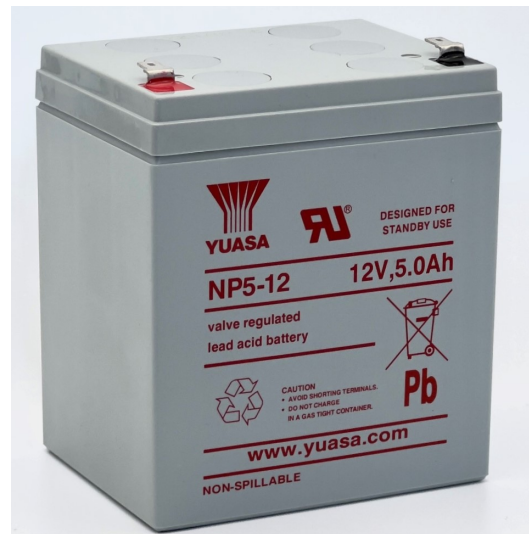
Layout - Abbildung ähnlich